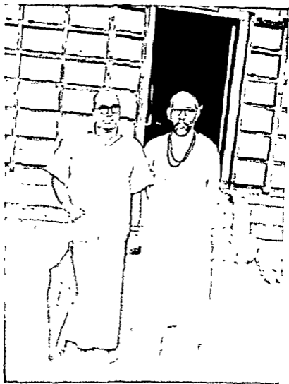
स्वाध्याय कर्मी सर स्वामी महाबादकेश्वरी